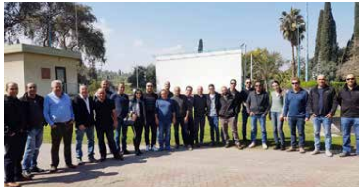
אנשי חברת סלע בינוי בהשתלמות מקצועית בגולן

יזום וביצוע: חברת סלע בינוי אדריכל: עוזי גורדון מתכנן אינסטלציה: אלישע פרנקל מנהל הפרויקט מטעם סלע בינוי: עבד עומרי מערכות אינסטלציה: מולטיגול של גולן מוצרי פלסטיק מערכות שפכים ודלוחין: תוצרת גולן - valsir