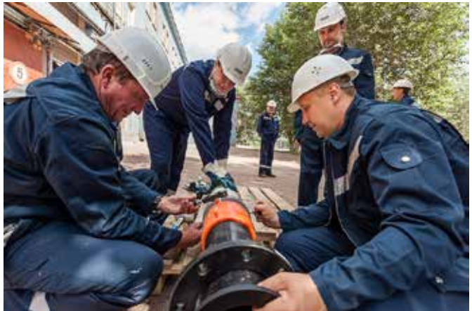
בתמונה נראית התקנה בסיביר (רוסיה) במפעל רוסל - לייצור אלומיניום

בימים אלה, לאחר שההתקנה הוכיחה את עצמה במהלך מספר שנים, מתוכנן המשך התקנה של הקו בצנרת פקסגול.