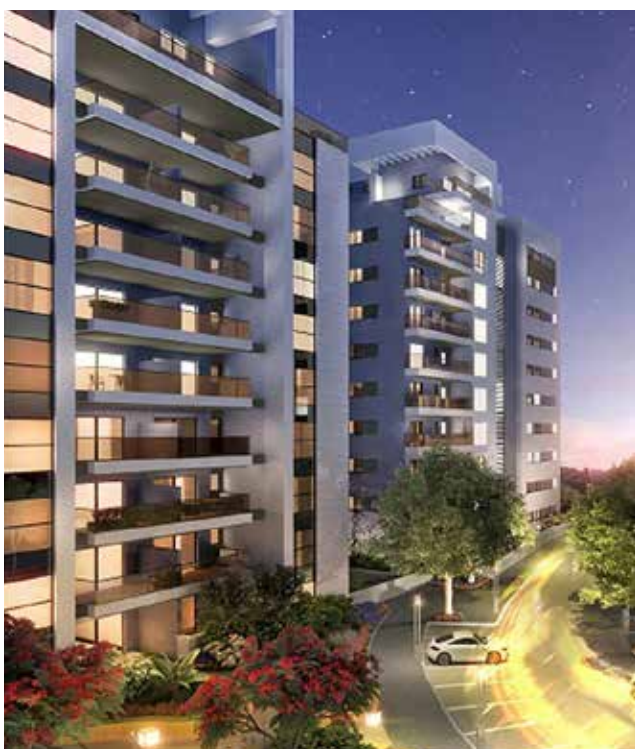
גן העיר - נהריה | הדמייה