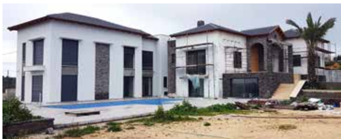
יילה במעלה הגבעה - דלית אל כרמל, בביצוע סאפי