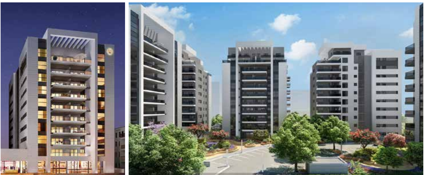
גן העיר - נהריה | הדמייה