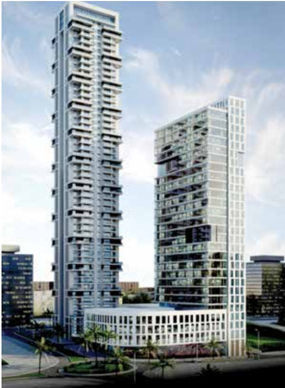
uptown בת-ים, מנהל פרוייקטים-אלון מורד