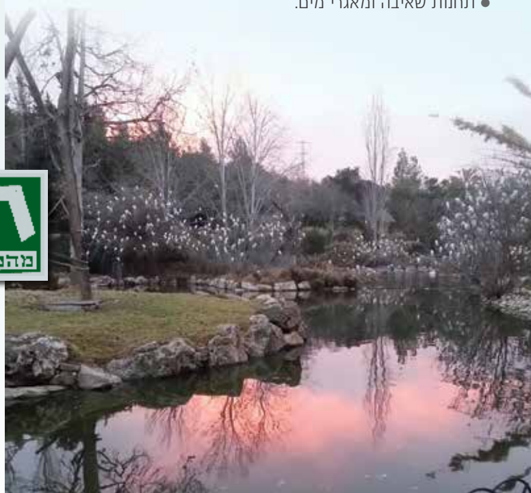
פרוייקט רחוב אגריפס - עדן, החברה לפיתוח מרכז ירושלים