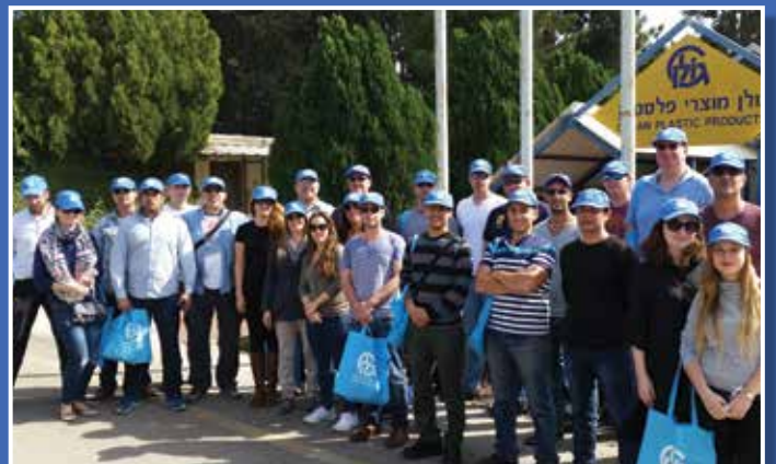
צוות חטיבת המגורים בסיור מקצועי במפעל גולן

בחלק ניכר מהפרוייקטים של חטיבת המגורים מתבצעים בצורת מבית גולן מוצרי פלסטיק.