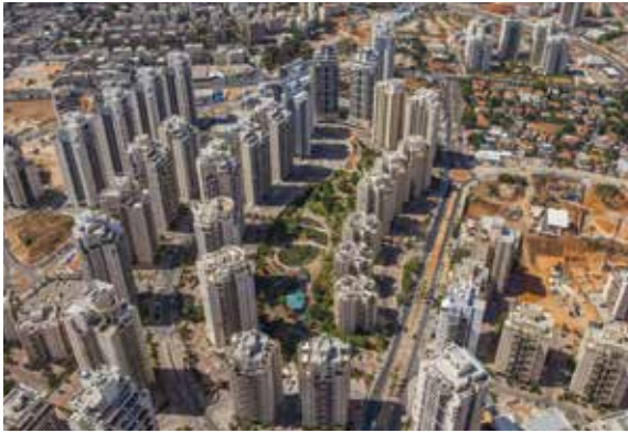
לב הסביונים - פתח תקווה, מנהל פרוייקטים-יוגב מרקוביץ