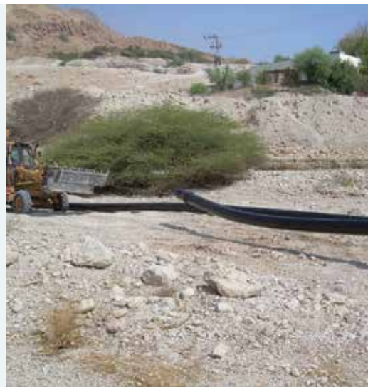
פרוייקט נחל דוד - פקסגול

וקצת צבע , רז מהנדסים, כחברה קבלנית לעבודות פיתוח ייחודיות, מבצעת פרויקטים של תשתיות ציורי קיר עבור החברה לפיתוח מזרח ירושלים.