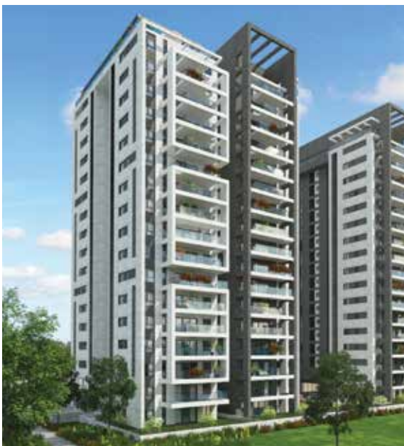
שכונת סביוני גבעת שמואל, מנהלת פרוייקטים-לי כהן גולן