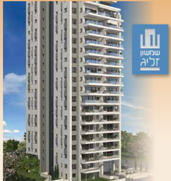
פרוייקט שמשון זליג, ראשון-לציון