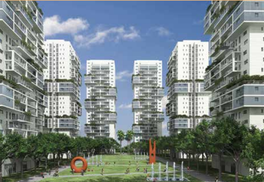
האחים דוניץ פרוייקט קריית האמנים, ראשון-לציון

מריאל עוזרי בע"מ חברה לבניין ולעבודות צנרת