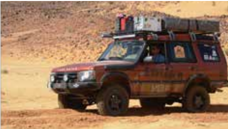
עוזי כדורי בשטח