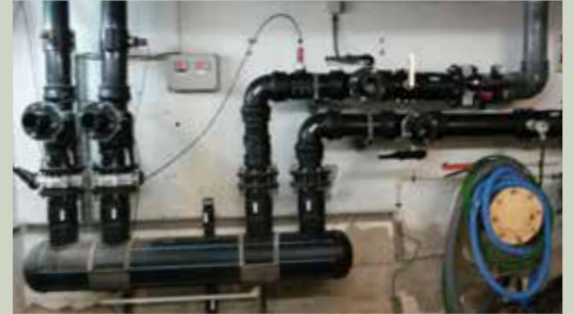
צנרת פקסגול מחוברת לסעפת - פלסאון