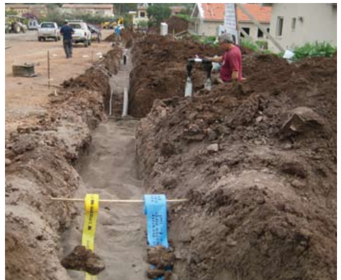
הרחבה קבוצת כינרת - תשתיות מים וגז עם צנרת פקסגול