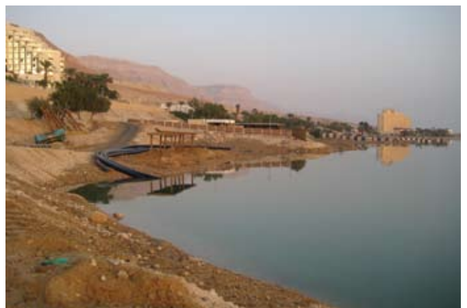
מלון נירוונה ים המלח - צינור פקסגול 450 מ"מ

כל החידושים באתר גולן מוצרי פלסטיק, שווה ביקור: www.golanplastic.co.il