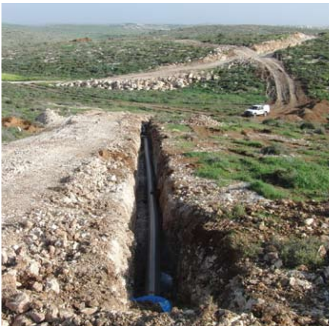
קו מים ראשי פקסגול 225 מ"מ עבור תשתיות לישוב חדש בחבל לכיש