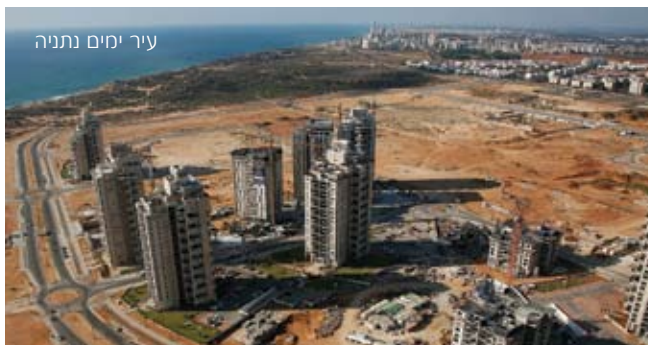
עיר ימים נתניה