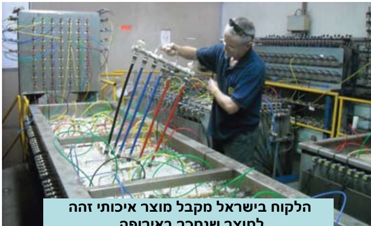
הלקוח בישראל מקבל מוצר איכותי זהה למוצר שנמכר באירופה.

הגלובליזציה והסחר העולמי חוצה הגבולות שינו באופן דרמטי את הסביבה העסקית הבין-לאומית, כיום 80% מהסחר העולמי מושפע מתקנים. גם גולן כשחקנית במגרש הגלובלי, נדרשת להשתלב במגמות בין-לאומיות אלה ולהתאים עצמה תפיסתית, מקצועית ומערכתית לדרישות של התקנים הלאומיים והבין לאומיים.