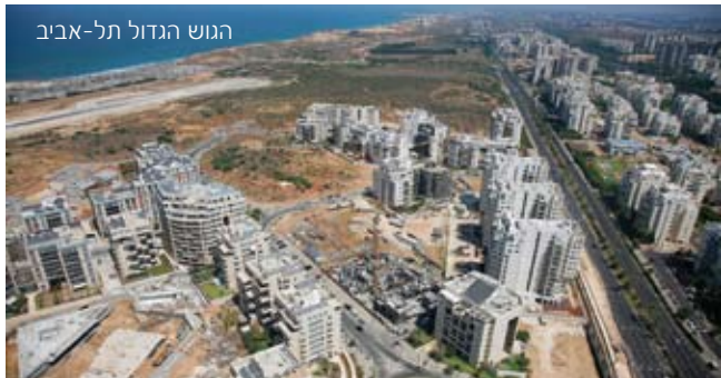
הגוש הגדול תל-אביב