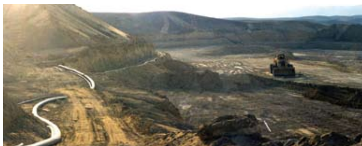
27 קילומטר "פקסגול" מפריקלס לים המלח