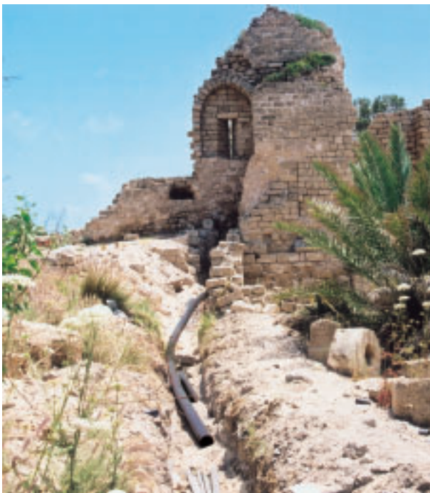
אילוס: ד. חזק

הורדוס, כמי שבנה את קיסריה ודאג לספק לה מים ממרחקים באמצעות מערכות מורכבות, היה מתאהב בתכונות של מערכות "פקסגול". באיחור של אלפיים שנה שוקמה מערכת המים של אתר קיסריה המשוחזר, באמצעות מערכות "פקסגול" במגוון קטרים. המים שוב זורמים בקיסריה במערכות צנרת שנועדו לשרת את האתר שנים קדימה.